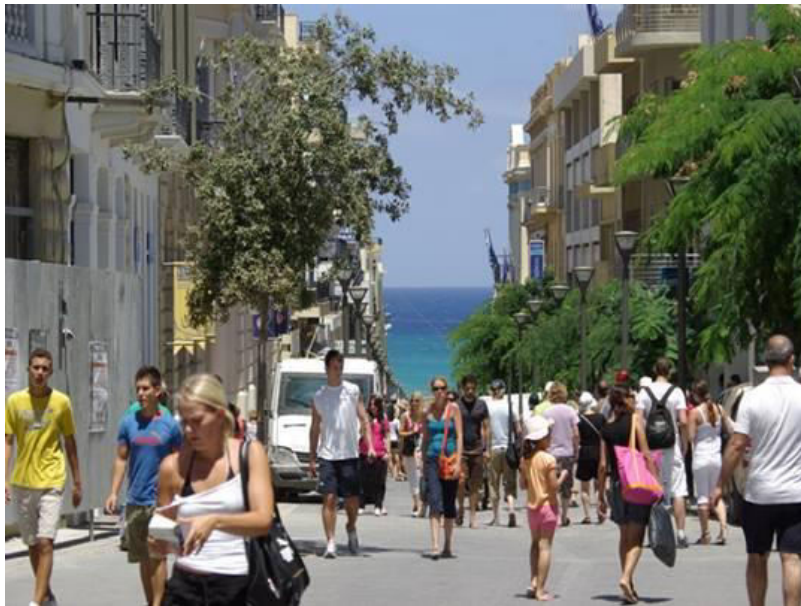
Η Ruga Maistra βλέπει όπως είναι φυσικό, στο Μαΐστρο.

Είναι για πολλούς λόγους τα interna corporis της πόλης του Ηρακλείου, αυτός ο δρόμος, από τότε που τον αιματοκύλισαν χωρίς αιτία οι Βασιβουζούκοι, στις 25 Αυγούστου 1898, ημέρα της εορτής του Αγίου Τίτου. Και δεν έμεινε λίθος επί λίθου.