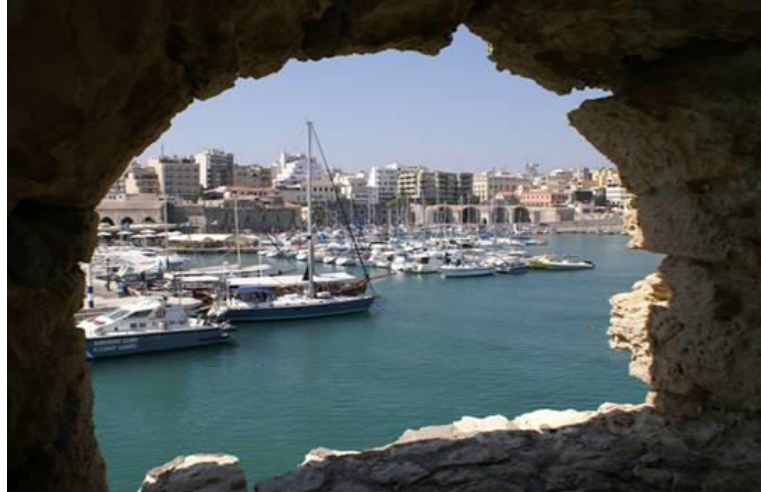
Η θέα προς το Ενετικό λιμάνι και την πόλη του Ηρακλείου από τους προμαχώνες του Rocca al Mare (Κούλες).

Αρχηγός των βασιβουζούκων που προκάλεσαν τις ταραχές ήταν ο διαβόητος Αλή Ούμπασης, που μετά το μακελειό, με δική του εντολή έβαλαν φωτιά σε σπίτια και καταστήματα του Βεζίρ Τσαρσί (της Ruga Maistra), καταστρέφοντας τα πάντα.