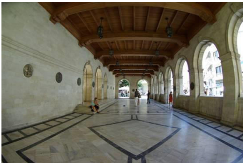
Το ισόγειο της Loggia εξακολουθεί να είναι μια ανοικτή στοά, όπως ήταν πάντα.

Η δεύτερη Λότζια (Loggia) ήταν κτισμένη απέναντι από εκεί που βρίσκεται η σημερινή, αλλά το 1541 έδωσε και αυτή τη θέση της σε μια Τρίτη Λότζια, που κτίστηκε στο σημείο που βρίσκεται η σημερινή. Όμως, 65 χρόνια μετά την ανέγερσή της, το 1626, ο Φραγκίσκος Μοροζίνι αποφασίζει να την κατεδαφίσει και στη θέση της να οικοδομήσει ένα κομψότεχνημα, τη σημερινή Λότζια, που θεωρείται το ωραιότερο Ενετικό οικοδόμημα στην Κρήτη.