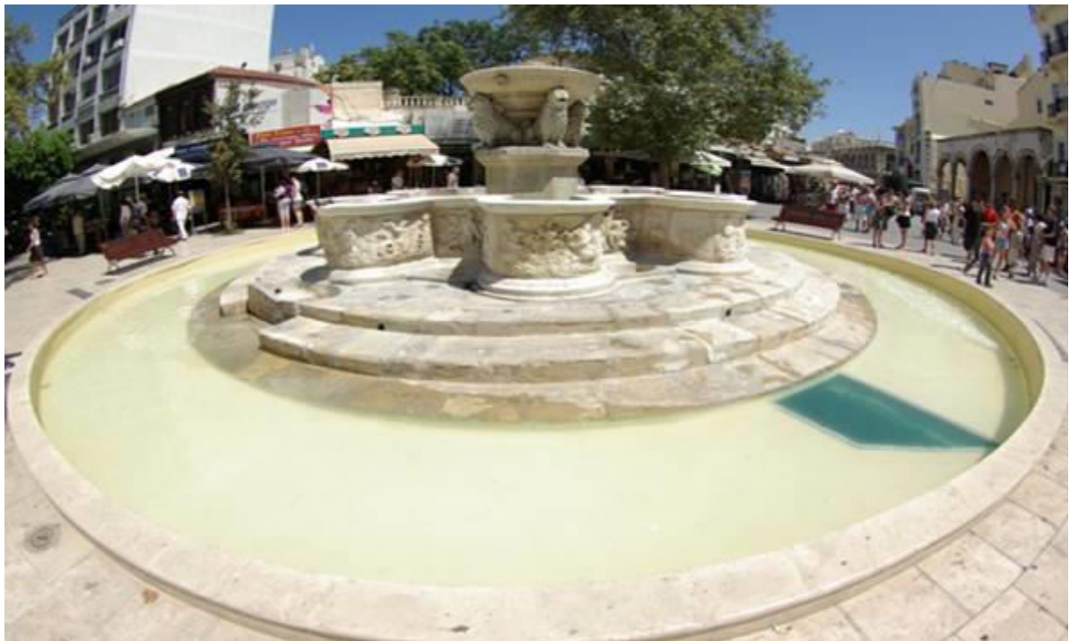
Η Κρήνη Μοροζίνη, όπως είναι σήμερα, μετά τον καθαρισμό και τη συντήρησή της.

Η Κρήνη Μοροζίνι είναι η κατάληξη ενός σημαντικού υδρευτικού έργου, του 17 ου αιώνα, που έφερε πόσιμο νερό από τις βόρειες υπώρειες του Γιούχτα στο Ηράκλειο, που μέχρι τότε υδρευόταν από πηγάδια. Η ιδέα για την κατασκευή αυτού του υδραγωγείου, όπως και της Κρήνης, ήταν του τότε Ενετού Προβλεπτή της Κρήτης, Φραγκίσκου Μοροζίνη.