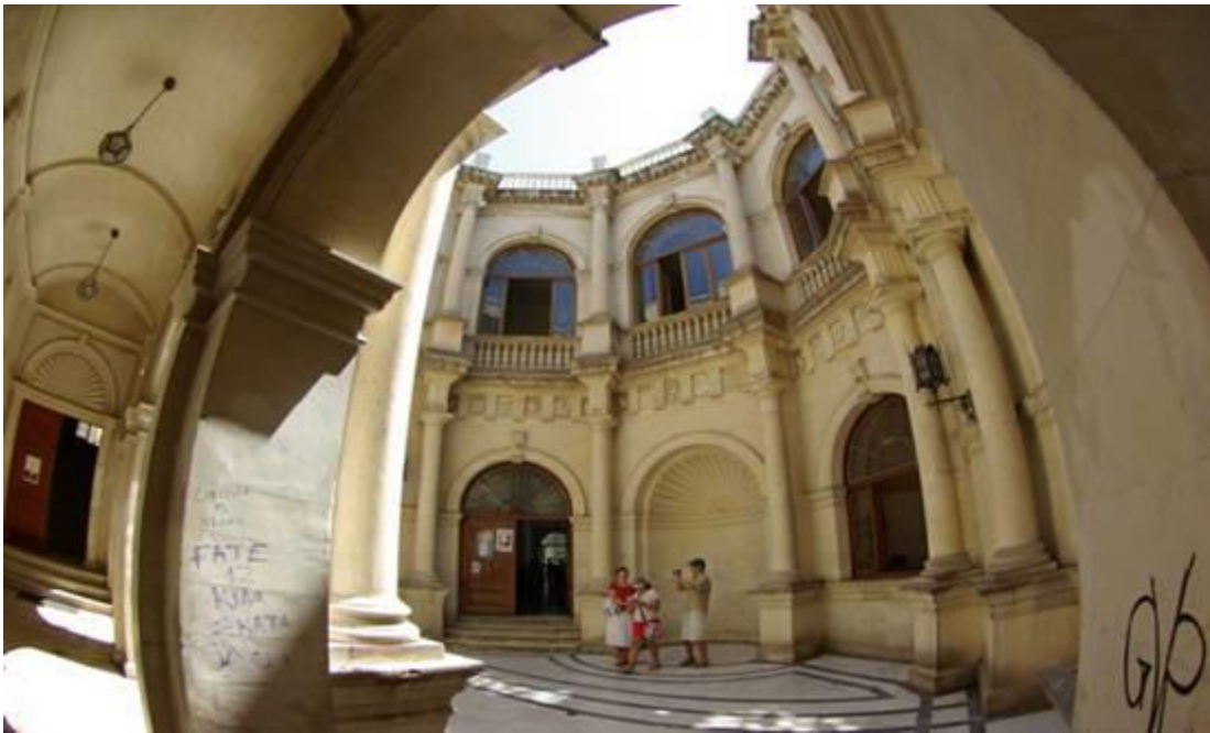
Οι αλλεπάλληλες τοξοτές πόρτες (πύλες), που οδηγούν στο αίθριο του ισόγειου.

Συνεπώς, η Loggia είναι ένα βασικό κομμάτι από τον κεντρικό κορμό της πόλης, όπως την οργάνωσαν οι Ενετοί. Δεν είναι τυχαίο ότι η Piazza delle bianche (η σημερινή Πλατεία Λιονταριών, ή αλλιώς Πλατεία Ελευθερίου Βενιζέλου) ήταν φτιαγμένη με πρότυπο την Πλατεία του Αγίου Μάρκου, στη Βενετία.